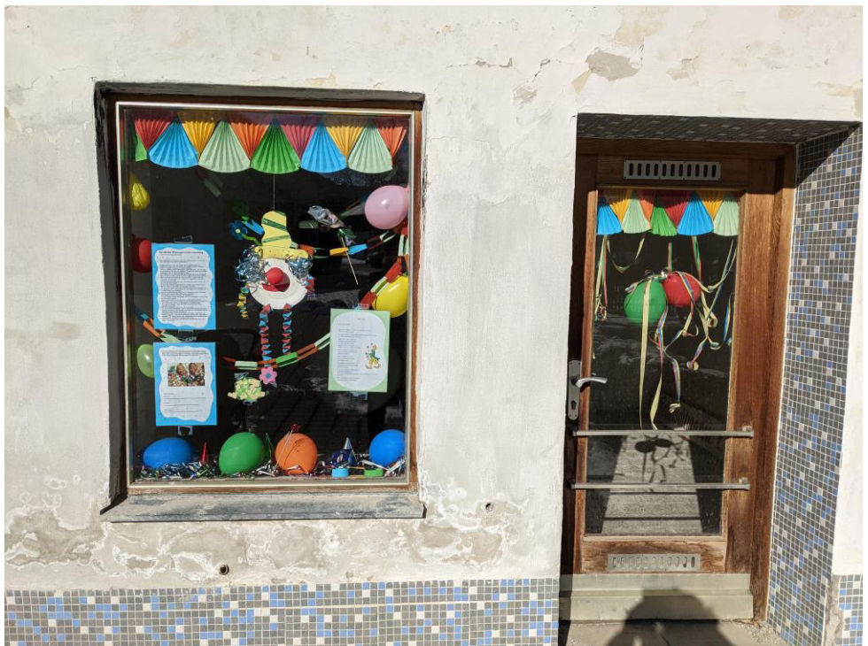
Gestaltet von Tanja Fischbeck

Vielen herzlichen Dank an Tanja Fischbeck für die liebevolle Gestaltung!