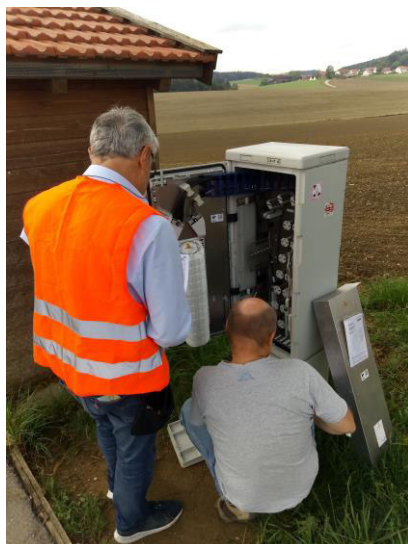
Vertreter der Firmen I2KT und vodafone bei der Abnahme

Seitens unseres Planungsbüros I2KT und unseres Betreibers Vodafone muss die Dokumentation als Nächstes zusammengestellt und schnellstmöglich ins System übernommen werden, damit dann die Anschalttermine