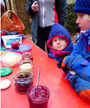
Für welche Füllung entscheide ich mich bloß?

Die erste Portion war bald verspeist und auch die zweite Ladung an Bratäpfeln ließen sich die Waldläuser schmecken – ein wahrlich leckerer Start ins neue Jahr!