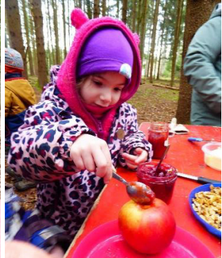
Gar nicht so leicht, die Marmelade in den Apfel zu bekommen