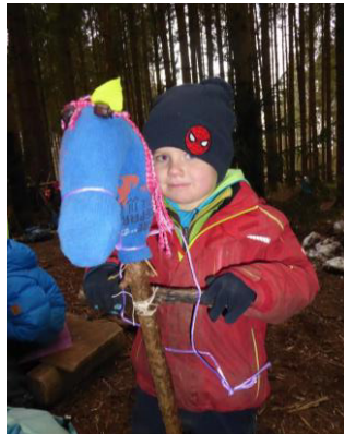
Blaue Pferde sind besonders schnell.....