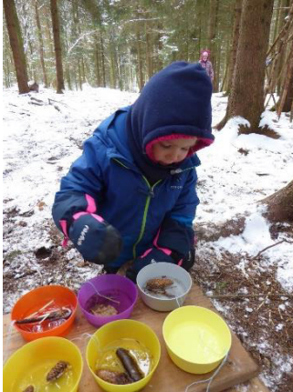
Bei mir passt auch noch was mit rein!“