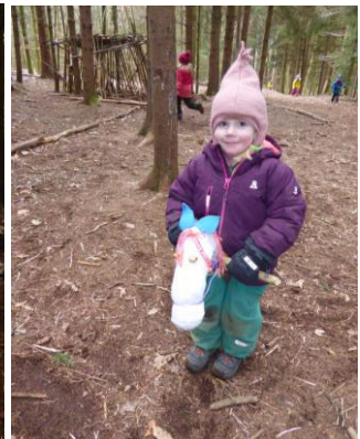
Ein weißes Pferdlerl mit seiner stolzen Besitzerin.