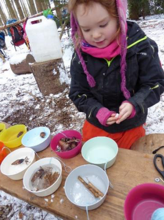
Wasser und kleine Waldschätze werden in die Schüsserl gefüllt.

Schüsserl wurden mit Wasser gefüllt, Zapfen, Rindenstückchen und andere Waldschätze hineingelegt und noch ein Wollfaden angebracht. Schließlich wollten man die Eiskunst ja auch aufhängen. Und dann hieß es geduldig warten. Gleich nach der Ankunft im Wald schauten die Kinder täglich nach – „Wieder nicht gefroren!“ – hieß es ein um's andere Mal. Doch schließlich hat es doch noch geklappt und die nächtlichen Minusgrade hatten kleine Eiskunstwerke gezaubert.