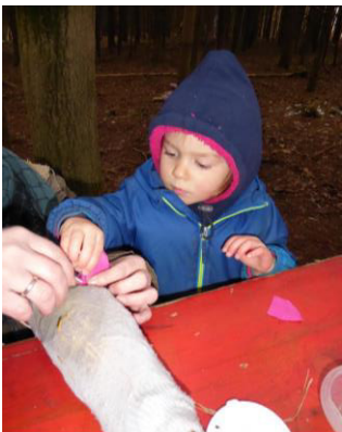
Gemeinsam werden die Ohren und Augen festgenäht.

Damit auch jeder ein treues Pferd sein eigen nennen kann, bauten die Kinder aus alten Socken, Stroh und Stöcken eine ganze Herde stolzer Vierbeiner. Die werden gefüttert, gestreichelt und wer weiß, vielleicht werden es einmal erstklassige Turnierpferde. Die Landshuter Hochzeit ist ja nicht mehr weit.