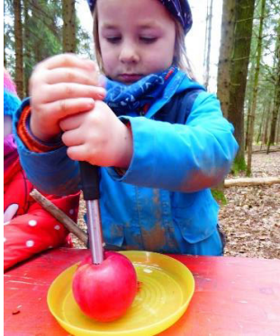
Zuerst muss das Kernhaus ausgestochen werden.