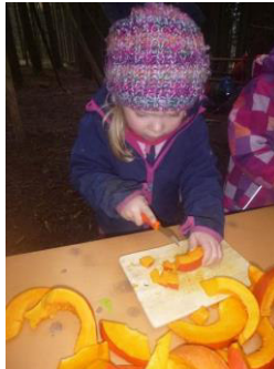
Viele fleißige Helfer beim Kochen der Kürbissuppe.