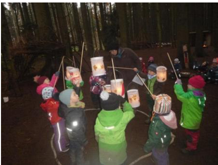
Volle Konzentration beim Laternentanz

„Und was hat euch am besten gefallen?“ fragten wir die Kinder am nächsten Tag. „Alles“ war die Antwort